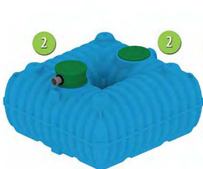
Ger-ekoplast 5000 litrů

Plastové plochá nádrže 5000 a 7000 litrů s integrovaným filtrem na sběr a využití dešťové vody. Možné použití i jako žumpa. Kvalitní plastová plochá nádrž z čistého plastu vhodná do spodní vody. Usazení bez betonáže. Záruka 25 let.