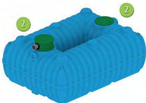
Ger-ekoplast 7000 litrů